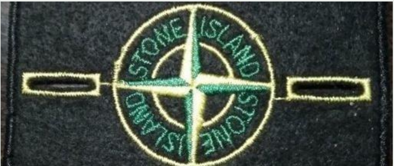
«Черная нашивка» оффника (ауешника)

- приглашение к участию в « забивах », сходках и др.